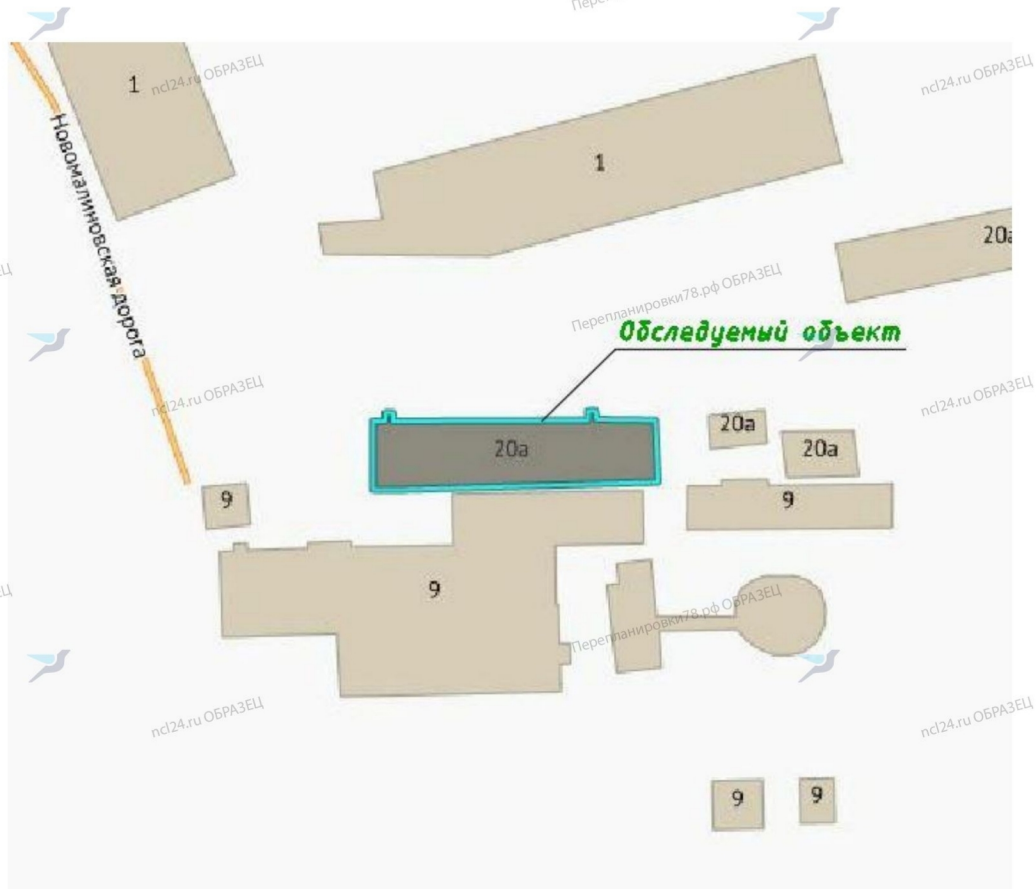
Рис. 1 Ситуационная схема расположения объекта